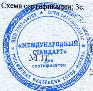
Схема сертификации: 3с.